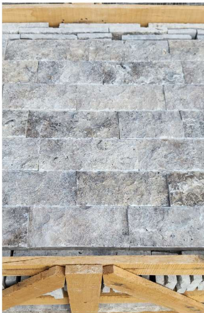
CAISSES BOIS POUR L'EXPORT