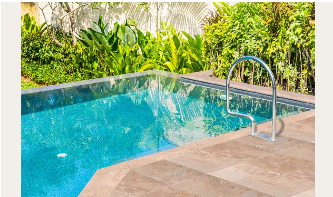
PLAGE & MARGELLE DE PISCINE — SURFACE ANTIDÉRAPANTE