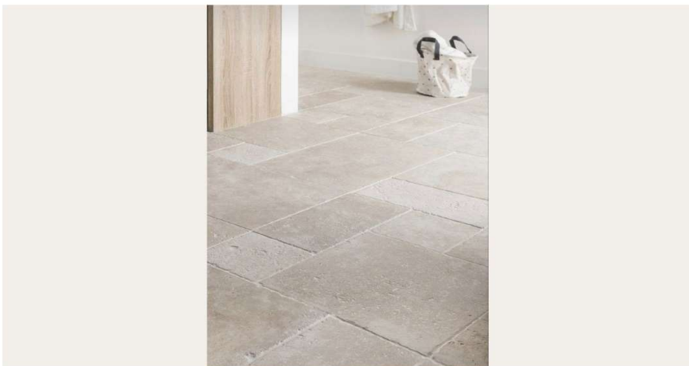
SOL INTÉRIEUR GRAND FORMAT