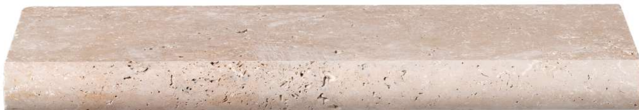
Profil de la margelle bullnose — vue de côté