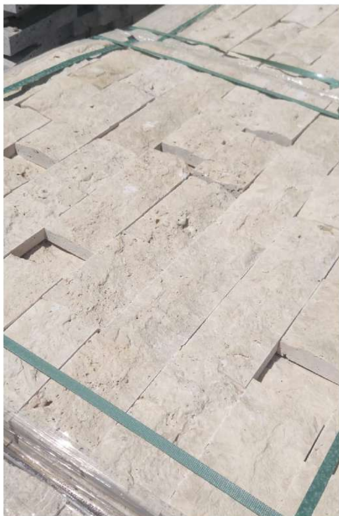
PALETTES FILMÉES & CERCLÉES