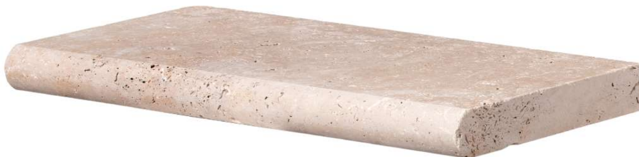
Vue d'ensemble de la pièce